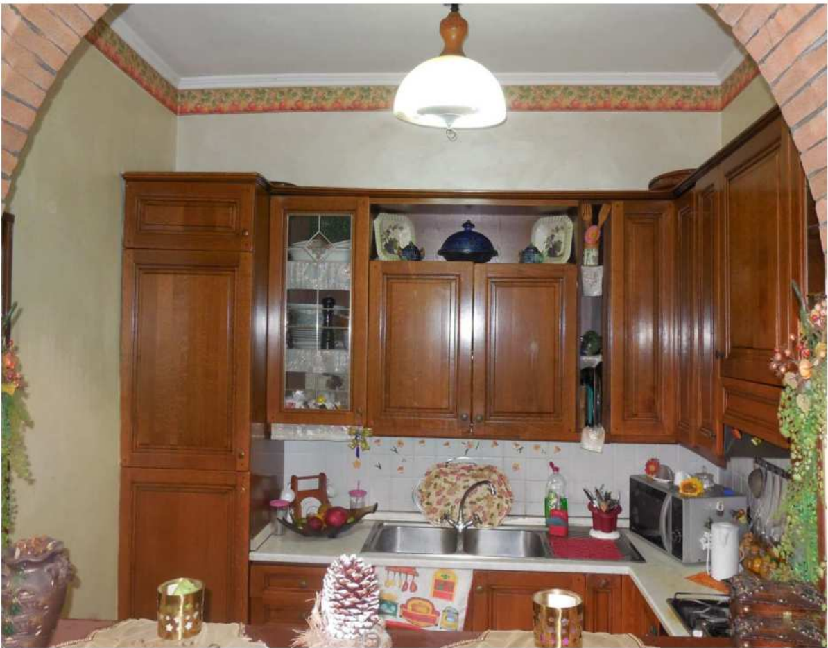
Foto 16 - La cucina vista dal varco della sala