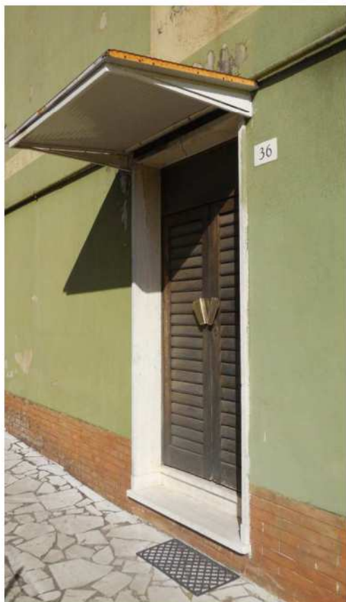
Foto 7- Portone condominiale