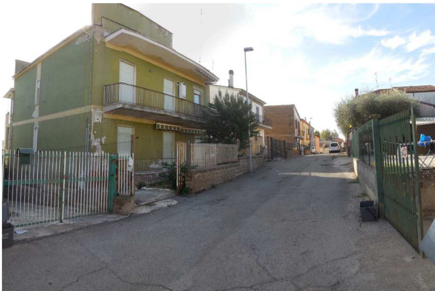
Foto 4 – Vista dello stabile provenendo dal lato opposto al precedente