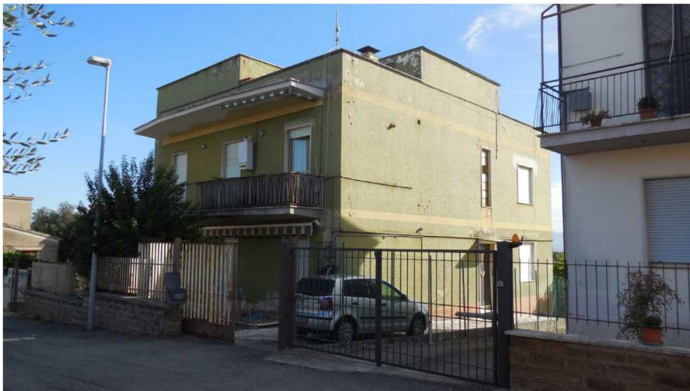
Foto 3 – Vista dello stabile percorrendo via Priati, provenendo da via Roma