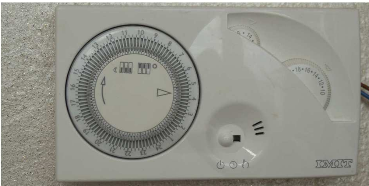
Foto 25 - Cronotermostato