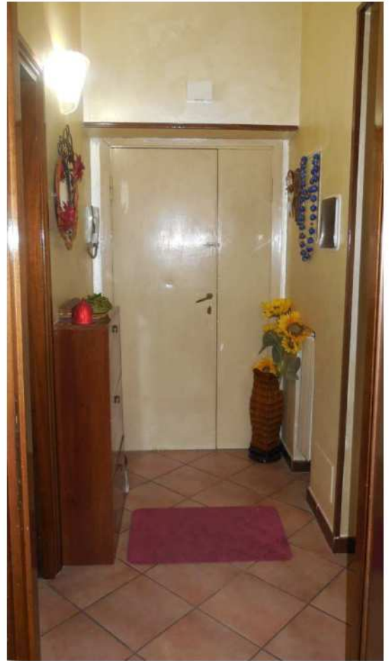
Foto 10 Ingresso