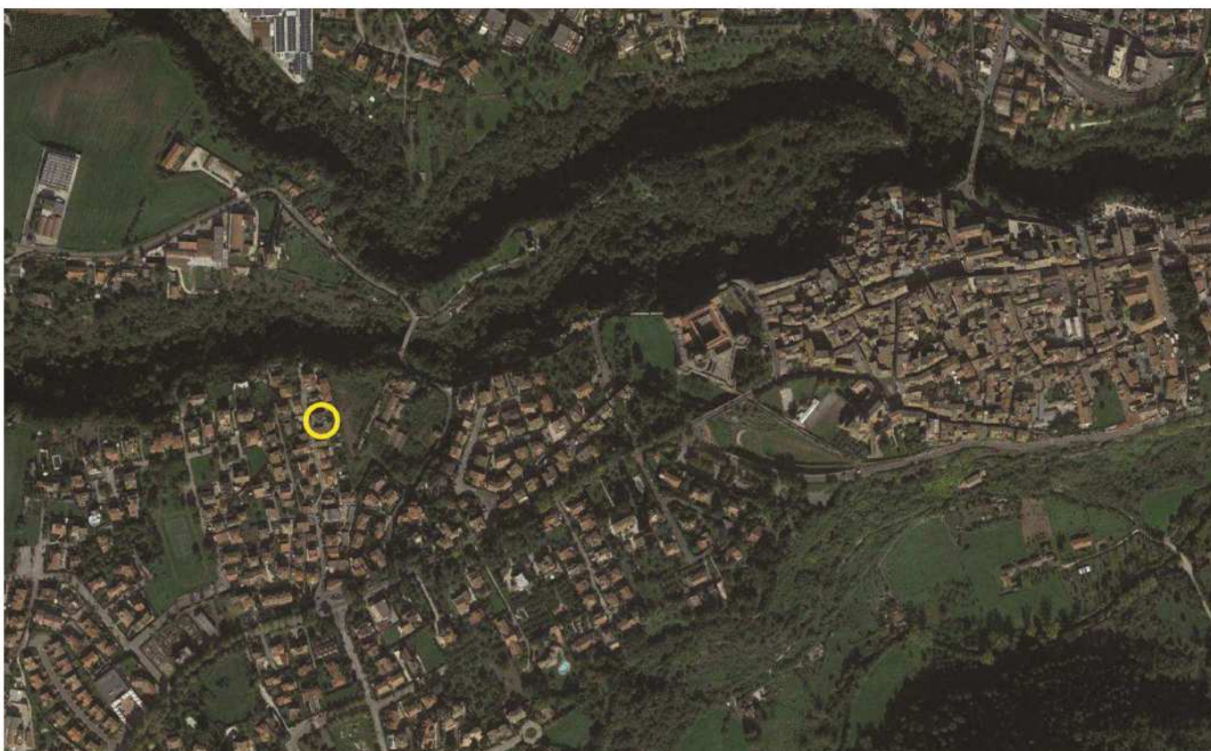
Foto 1 - Immagine satellitare di un ampio contesto urbano