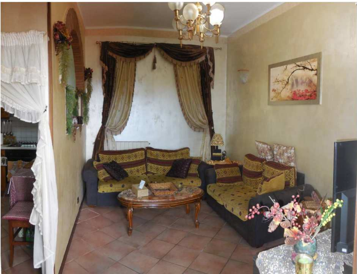
Foto 17 - Salotto