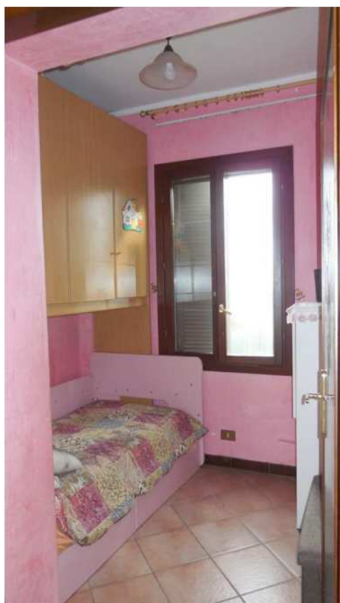
Foto 14 - Cameretta